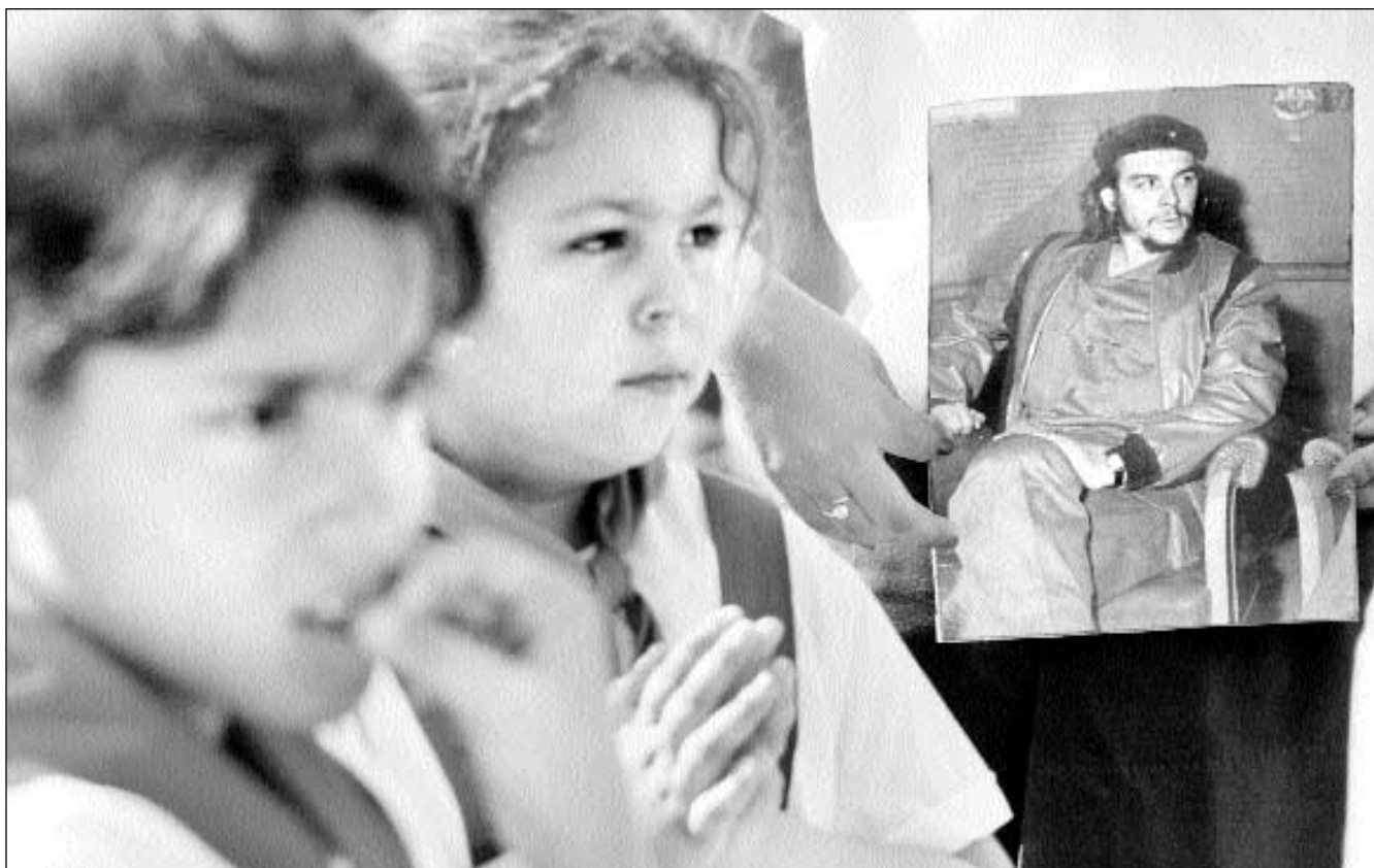
En todas las primarias de Cuba hubo ayer actos de homenaje a Ernesto Che Guevara, al recordar el asesinato del guerrillero hace 36 años

En 1955 se unió en México a Fidel Castro y decenas de voluntarios cuba-