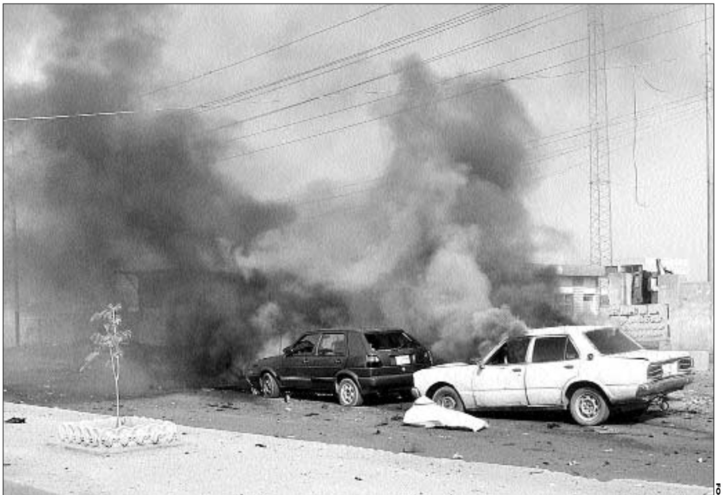
Varios vehículos ardieron tras el estallido de un coche bomba cerca de una comisaría en la ciudad de Fallujah, bastión sunita a 50 kilómetros de Bagdad; siete personas murieron. En Mosul, tres civiles perecieron en otro atentado con cohetes a un centro policial. El presidente estadounidense George W. Bush afirmó que los ataques no lo intimidarán, pero reconoció que Irak sigue siendo "un lugar peligroso"