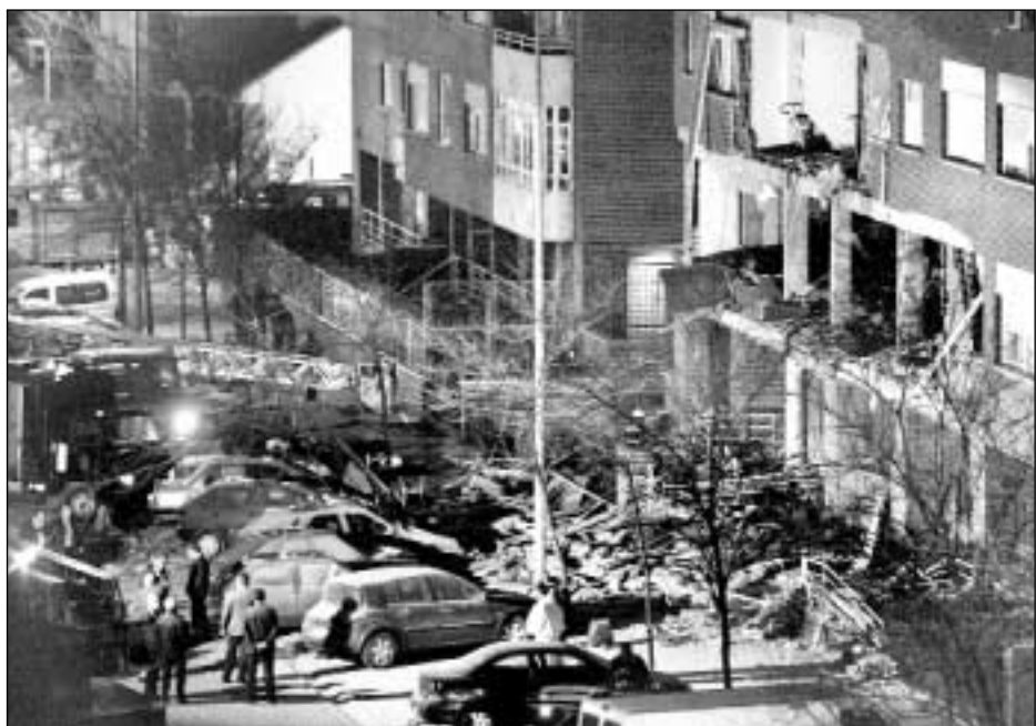
Policías y rescatistas españoles inspeccionan la escena de la explosión en un suburbio de Madrid, en el que tres sospechosos de los atentados del 11-M se inmolaron después de un tiroteo con agentes. Una mujer, integrante del grupo, también murió aunque su carga explosiva no detonó