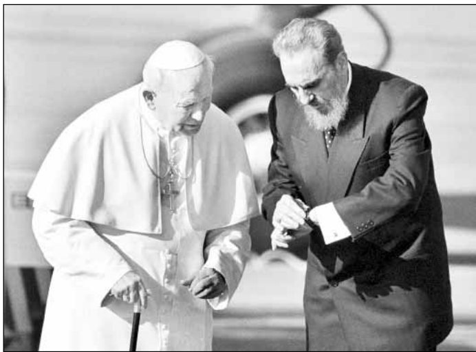
El histórico encuentro con el gobernante cubano, Fidel Castro (1998)