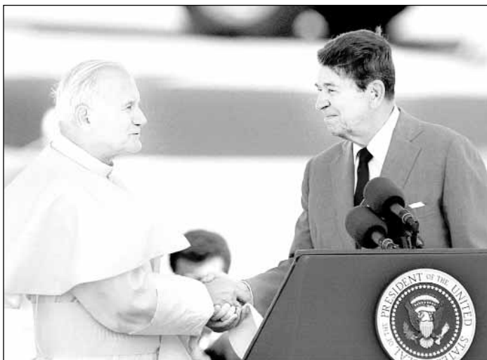
El líder religioso se reúne con el presidente de EU, Ronald Reagan (1987)