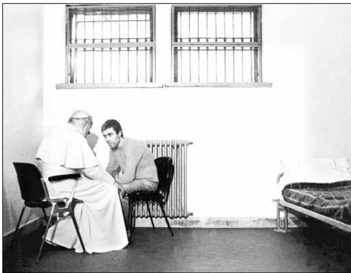
Juan Pablo II otorga perdón a su agresor turco Mehmet Ali Agca (1983)