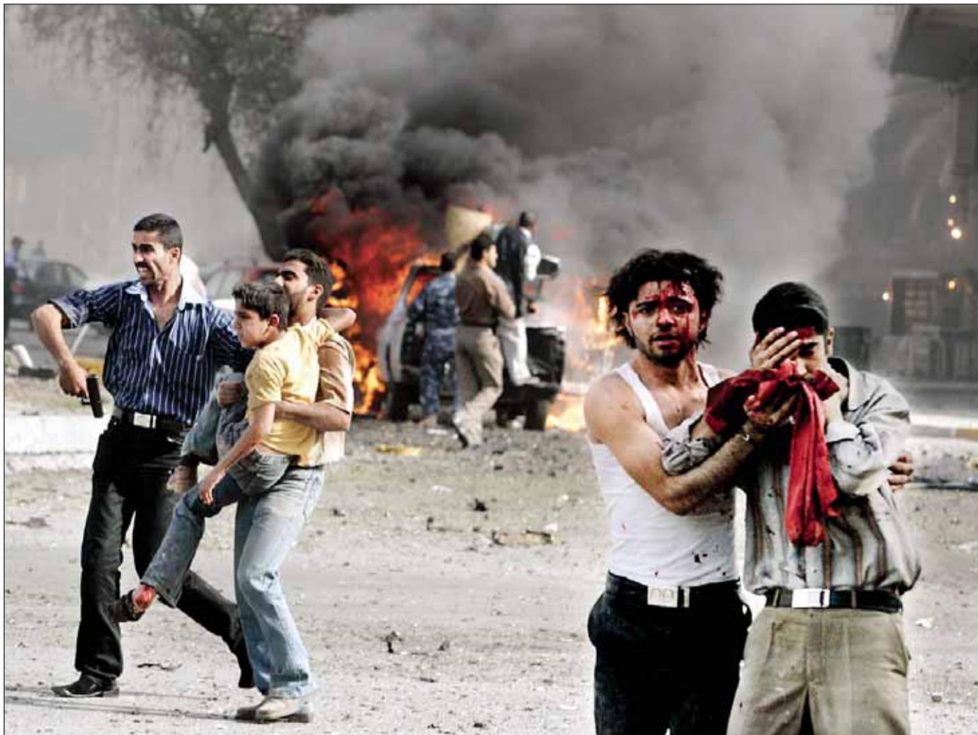
El Senado estadounidense aprobó una resolución que expresa su apoyo a las tropas en Irak, después de rechazar la propuesta demócrata, avalada en la Cámara de Representantes, que obligaría a una retirada en marzo de 2008. En el país árabe ocurrieron nuevos atentados con coche bomba, dos de ellos en Bagdad, que causaron la muerte de 16 personas; en la imagen, auxilio a víctimas tras el ataque a un puesto de revisión en la capital iraquí