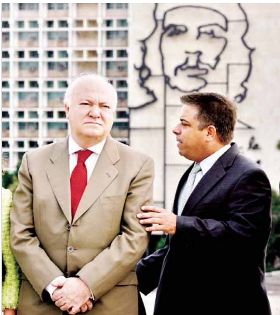
Los cancilleres de España y Cuba, Miguel Angel Moratinos y Felipe Pérez Roque, respectivamente, conversan en La Habana. Ambos funcionarios señalaron que sus gobiernos ya pueden sentarse a dialogar, pese a diferencias, al tiempo que abrieron el camino para mejorar la relación de la isla con la Unión Europea