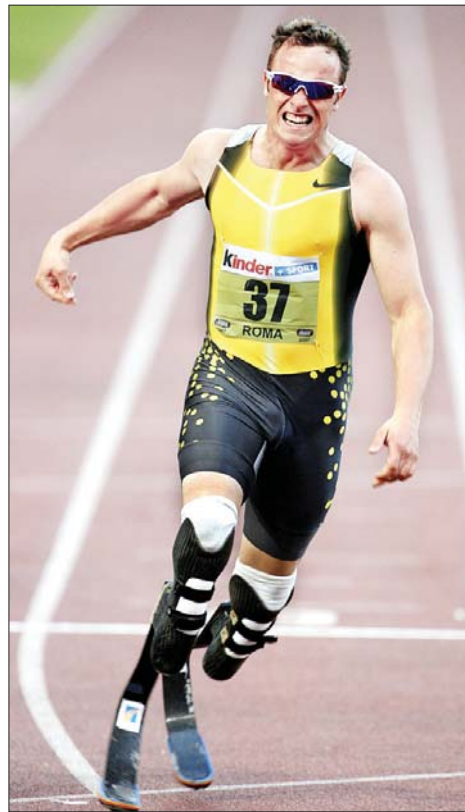
El atleta sudafricano Oscar Pistorius podría ver frustrado su deseo de competir en Pekín 2008 y advierte que lo intentará hasta las últimas consecuencias

Pistorius, a quien se le permitió correr dos competencias de la IAAF la pasada temporada con fines de estudio, se sometió en noviembre