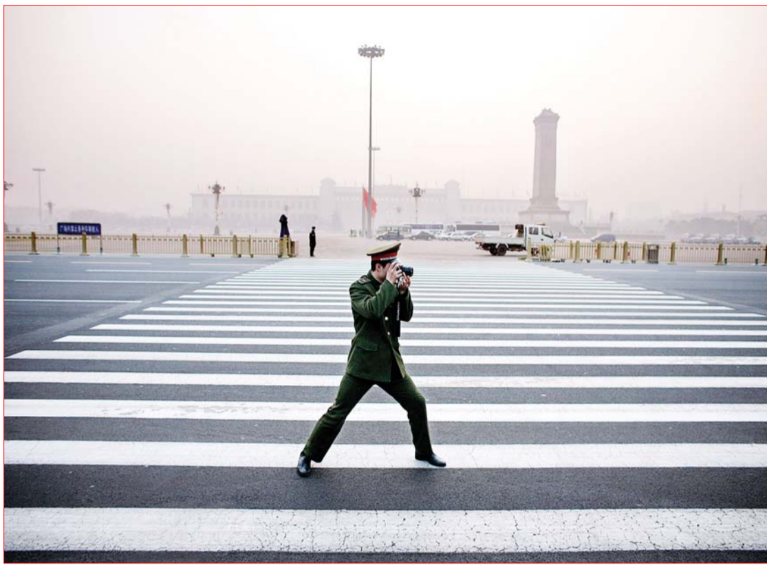
Un policía paramilitar fotografía a un compañero en la plaza de la Puerta de la Paz Celestial, este lunes, en Pekín