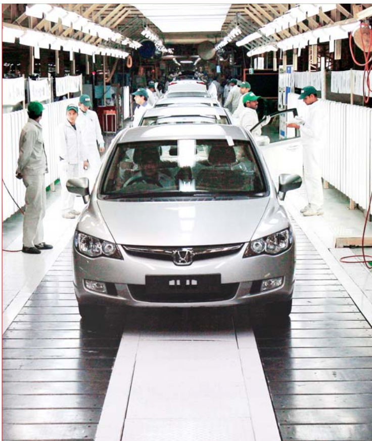
Supervisión de la producción de autos Honda en las afueras de Nueva Delhi, India, donde la firma japonesa prevé aumentar sus ventas

La primera obligación es hacerlo en serio. Profundizar más.