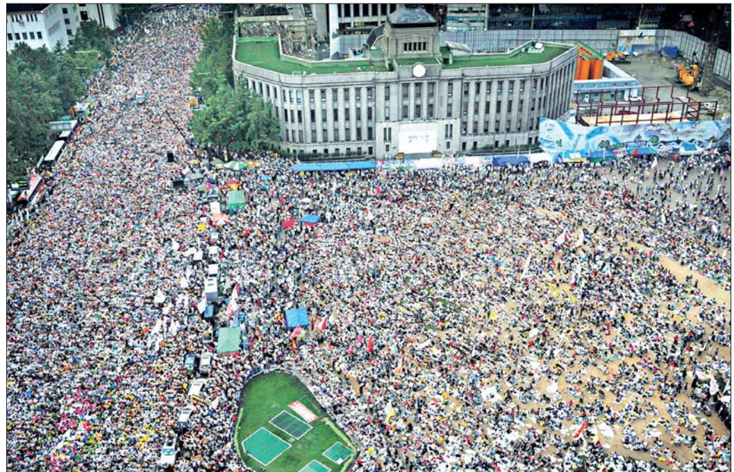
Decenas de miles de manifestantes marcharon por las calles de Seúl, Corea del Sur, para exigir la renegociación del tratado de importación de carne de res que se firmó en abril pasado con Estados Unidos, y la renuncia del presidente sudcoreano Lee Myung-bak