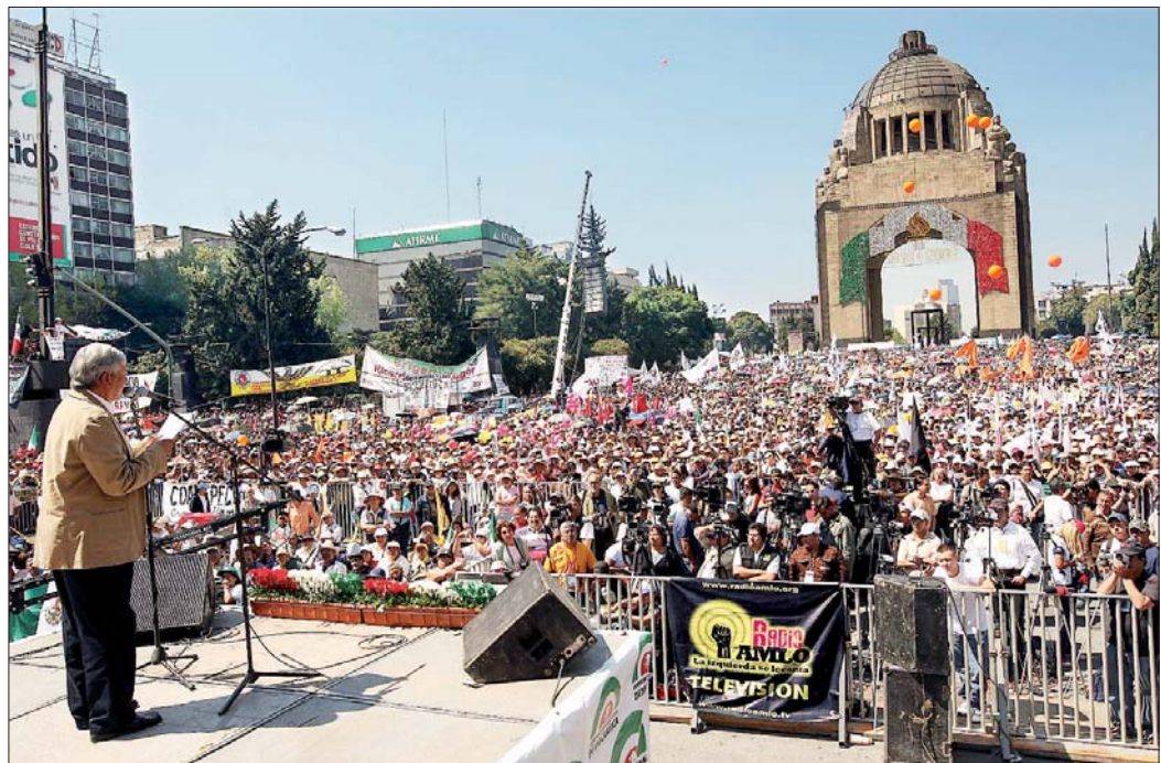
Ante miles de personas que se congregaron en el Monumento a la Revolución, Andrés Manuel López Obrador llamó a brigadistas en defensa del petróleo a congregarse mañana a las 8 horas en el Zócalo para de ahí partir a la Cámara de Diputados, donde se votarán los dictámenes sobre la reforma de Pemex. “El PRI y el PAN decían que no habría privatizaciones, pero no tardaron en enseñar el cobre”, expresó en su discurso