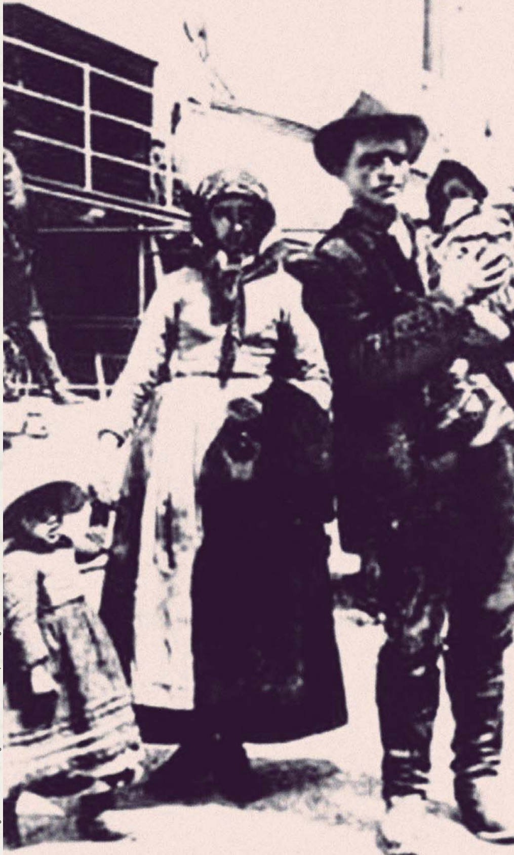
Foto: Inmigrantes Italianos del siglo XIX.