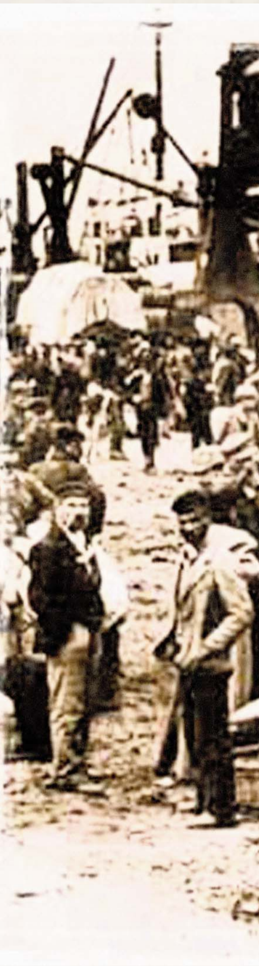
Fotos: De inmigrantes italianos del siglo XIX