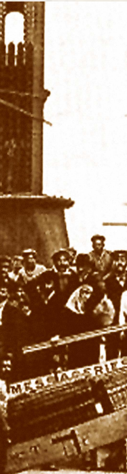
Foto: De inmigrantes italianos del siglo XIX, obtenidas en: http://regresados2007.blogia.com/temas/os-inmigrantes.php

supranacional (convenios en el Mercosur, convenio internacional sobre los trabajadores migrantes, declaración sobre derechos humanos). Por último, cuán diferente es el contexto demográfico que acompaña a los modelos: mientras en el primero se intensifica la inmigración europea, en el segundo ésta ya no existe, y la limítrofe conserva su presencia sobre el total de la población, mientras crece dentro de la extranjera. En el integrador, la población extranjera muestra su porcentaje más pequeño desde el primer censo (1869), al mismo tiempo que crece la emigración. Las políticas reflejan ese panorama: en el primer caso se legisla pensando en los europeos; en el segundo se los fomenta, mientras se restringe al no deseado inmigrante limítrofe, y en el último, por primera vez, no sólo se contempla el flujo latinoamericano, sino que se otorga a los ciudadanos de la región un trato diferenciado.