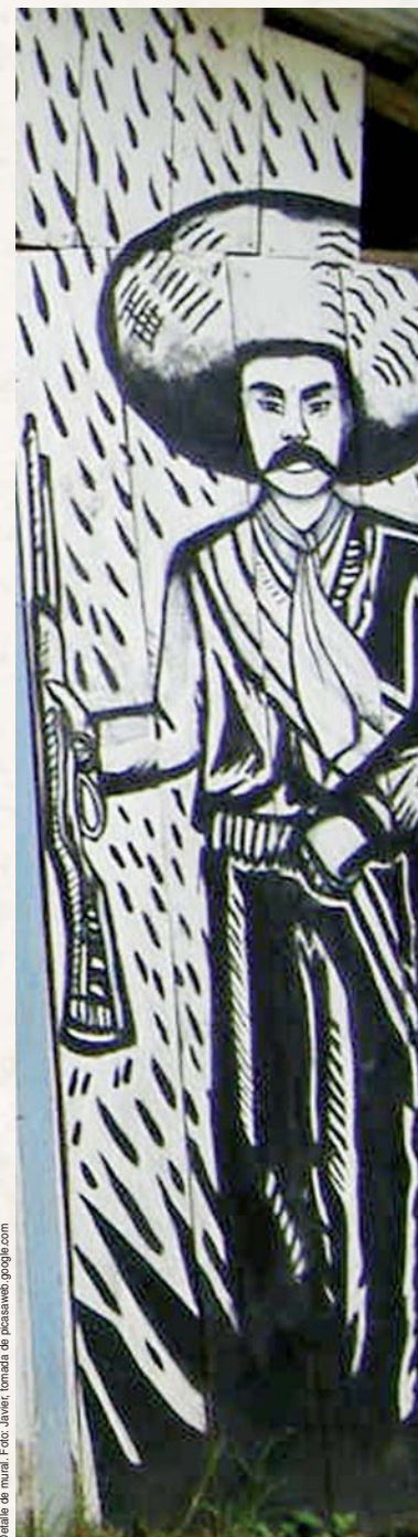
Detalle de mural.

** Socióloga y doctora en antropología. Investigadora del Centro de Estudios Latinoamericanos de la Facultad de Ciencias Políticas y Sociales de la Universidad Nacional Autónoma de México (Cela-FCPyS/UNAM).