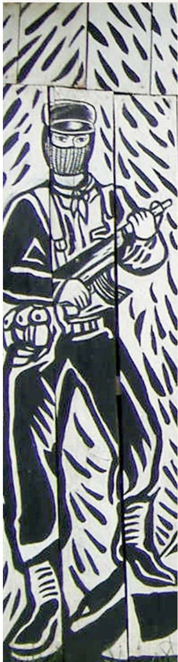
Detalle de mural.