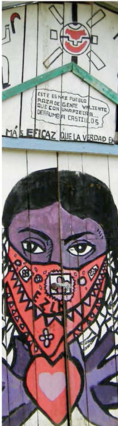
Detalle de mural.