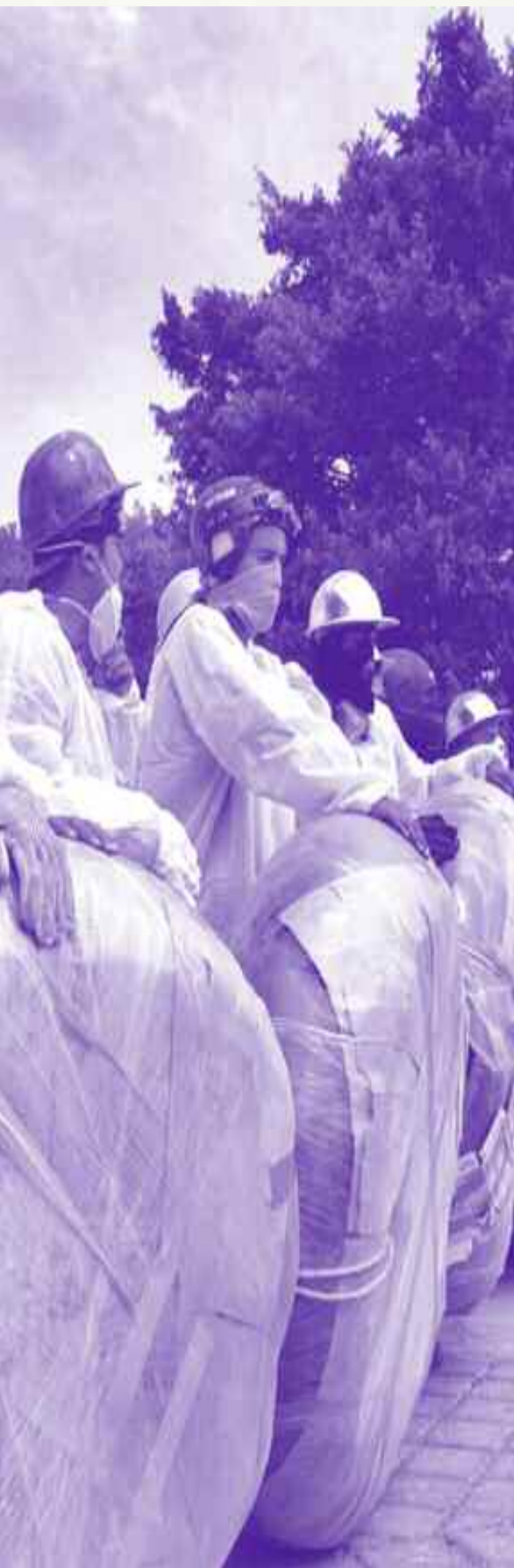
Fotos: Grupos de jóvenes altermundistas protestan contra el Foro Económico Mundial en la ciudad de Cancun, Quintana Roo, el 27 de febrero del 2001.

...sos, pobre y, muchas veces, abandonada a su suerte. En materia democrática, la universalización de la escuela y la igualdad de oportunidades y condiciones educativas para todos, forman parte del mismo proceso. “Universalizar” un sistema pobre para los pobres y preservar inalterado un inventario de privilegios y oportunidades para los sectores más ricos, es lo que se ha hecho durante buena parte de estos pasados 200 años.