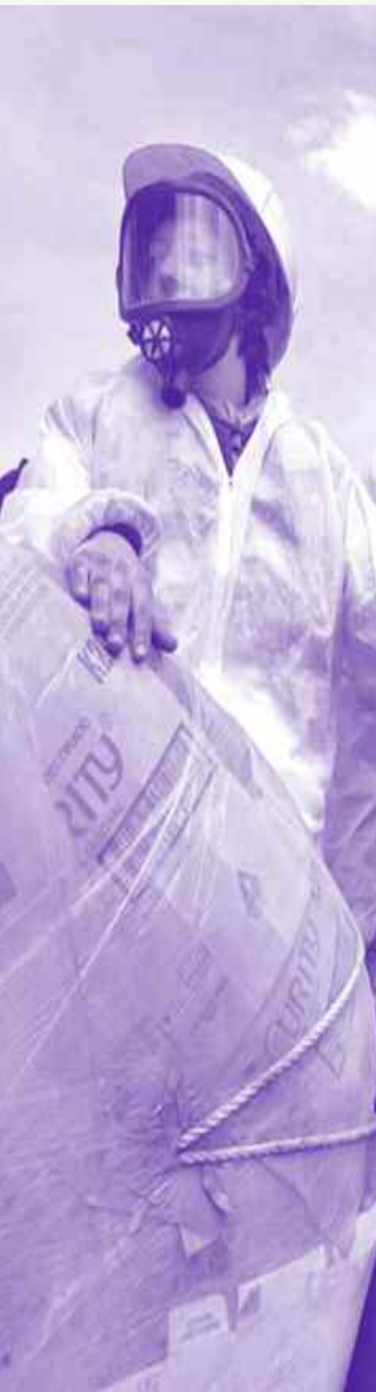
Fotos: Grupo de jóvenes altermundualistas protestan contra el Foro Económico Mundial en la ciudad de Cancun, Quintana Roo, el 27 de febrero del 2001.