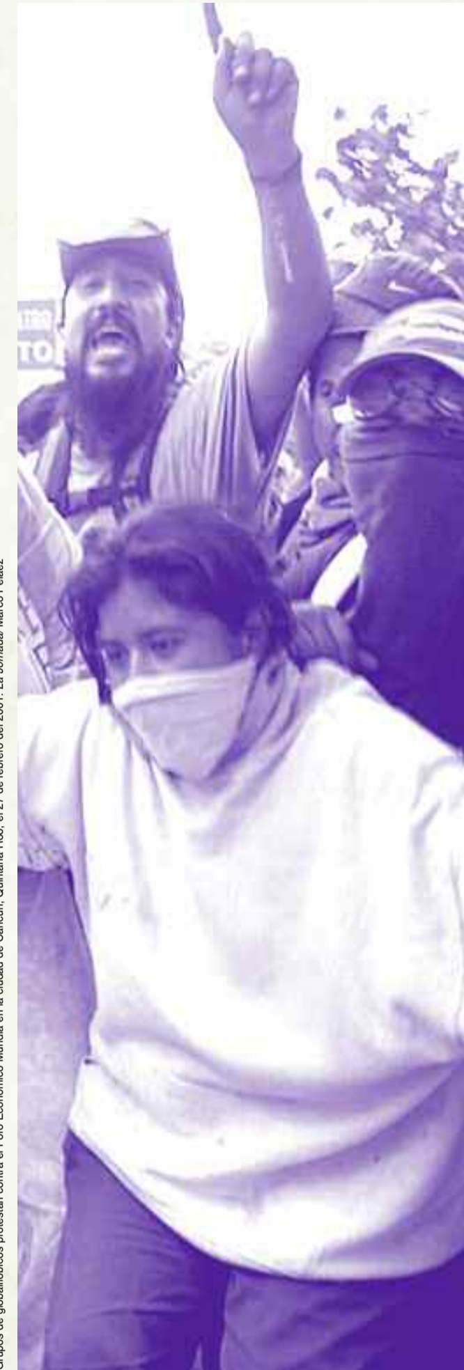
Grupos de globalifóbicos protestan contra el Foro Económico Mundial en la ciudad de Cancun, Quintana Roo, el 27 de febrero del 2001.

En cuanto a los contextos históricos, los estudios sobre la participación política de los jóvenes aparecen como reflejo de