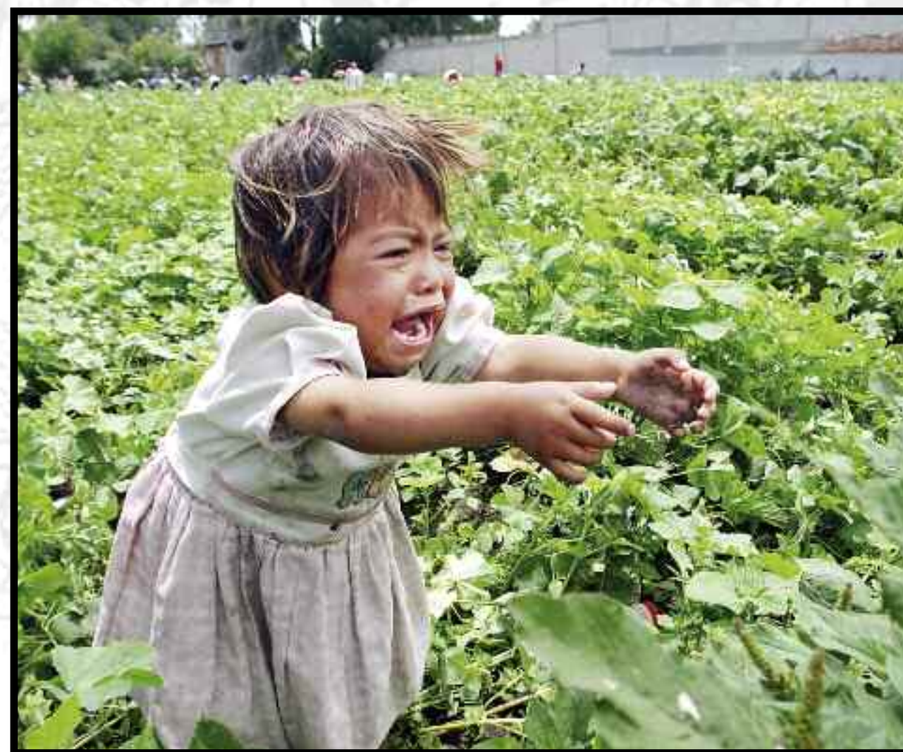
Progreso, Hidalgo.