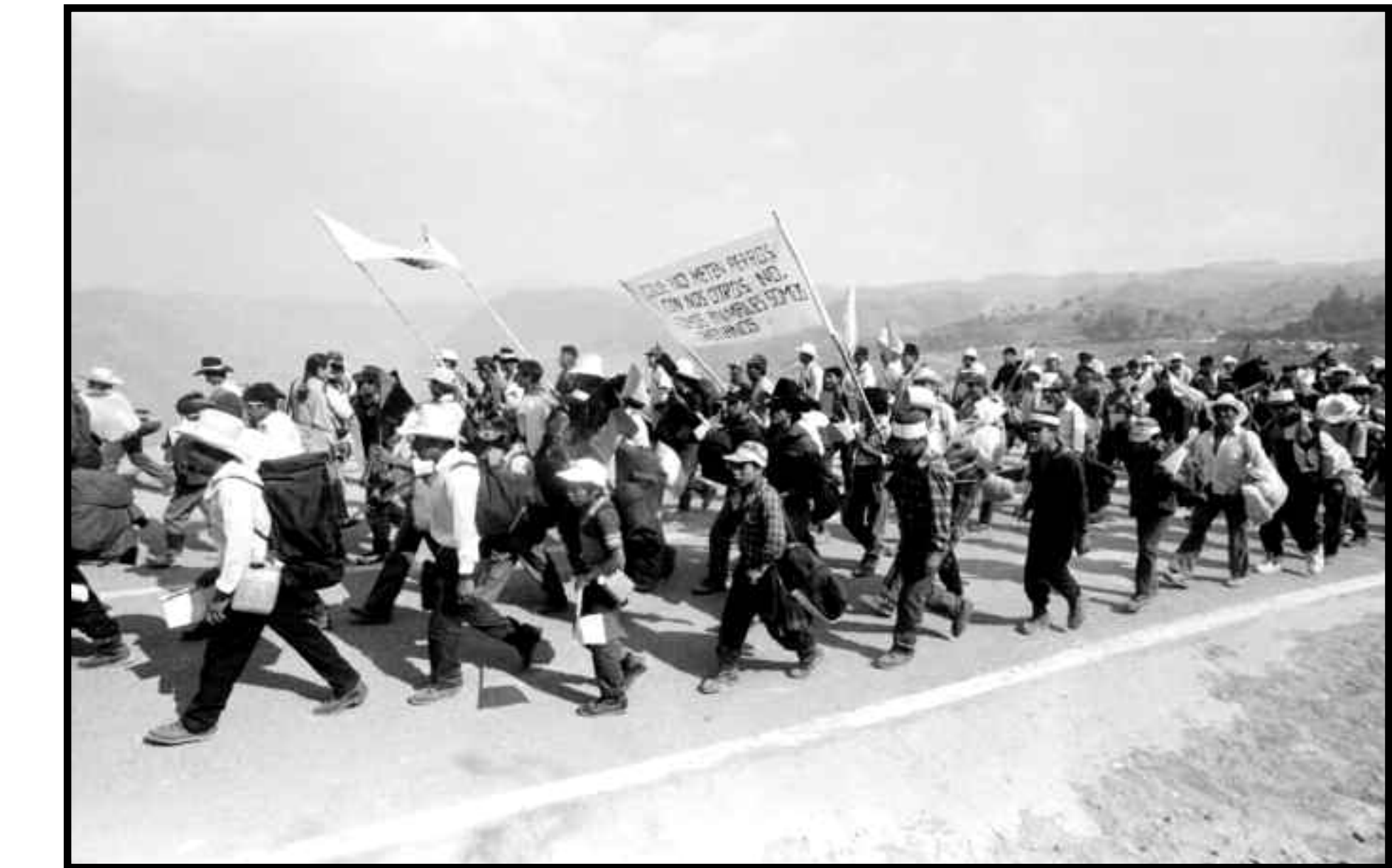
Bases zapatistas rumbo a los diálogos de San Andrés, Chiapas. 19 de abril de 1995.

Procesos electorales, narco y pueblos indios. En América latina hay dos posiciones respecto a lo indígena, y en México también se expresan: ambas enarbolan derechos indígenas y autonomía, pero unas quieren meterse al Estado para desde ahí hacer transformaciones, y otras no quieren