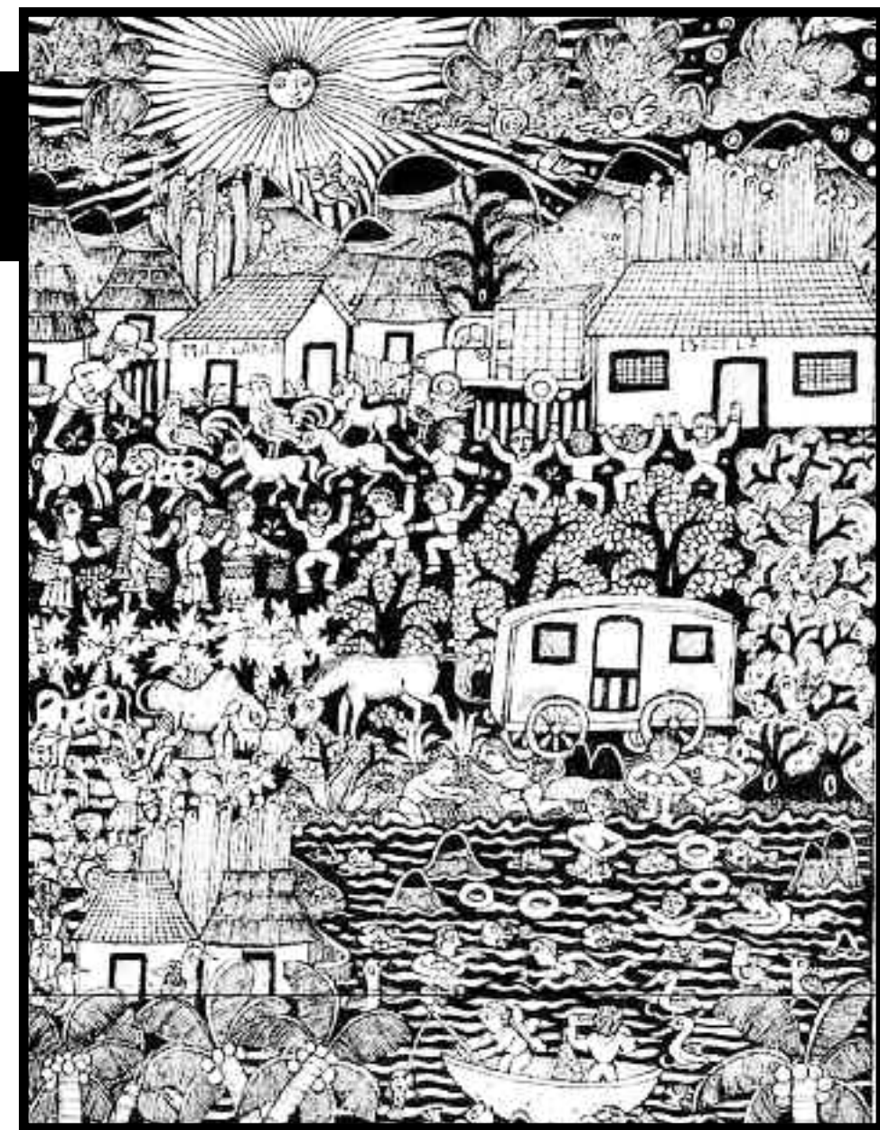
Ilustración: JAVIER MARTÍNEZ PEDRO. Detalle de Migrar, 2011

Espérame... Campo. Espérame con tus sombras de jacarandas. Colores morados de cuaresma. Aguárdame con tus ejidos copados de verde en los veranos aguazosos. Espérame con tus sombras flacas de esos árboles cargados con flores de cacaxotl-xóchitl, con tus nanchales colgados de frutas, con tus azucenas. Espérame con tus colinas áridas, rincones donde los duendes se aparecen al medio día