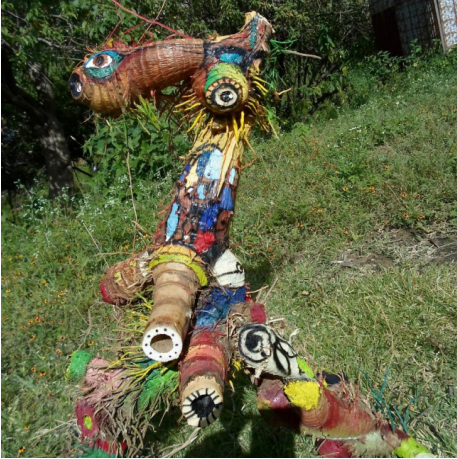
Ensamble, Equis X Rone, 2013

“En el ensamblaje quise hacer mis raíces pero llenas de vida, raíces que estaban muertas pero que ya les di vida [...] esa idea nació cuando fui a un río de por allá ¿no? Vi un carrizo tirado y dije ¿no?... Me imaginé muchas cosas, que era un personaje de allá, pues, eran personajes [...] ¡ah! ese es un tejorón [...] y les puse unas fusiones de pájaros, de animales, pues resultó eso, personajes antropomorfos” (Equis X Rone. 2013)