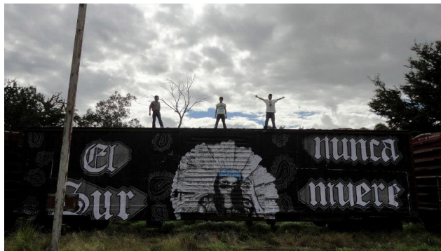
El sur nunca muere, Museo del Ferrocarril, 2012

“Lo cultural ahora ya se mezcló, en mi obra hablé mucho de eso[...] como los fenómenos extranjeros y más que nada en Oaxaca, que tiene un chingo de contacto tanto por el turismo como por gente que trabaja en los EU, esos fenómenos culturales se van mezclando [...]por eso es el pedo de “El sur nunca muere” [...] cholas vestidas de tehuana, fotos de facebook, “la gente del istmo cree mucho en la muerte [...] el rollo pandillero, yo lo mezclé en ese sentido” (Canul. 2013)