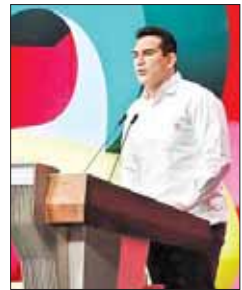
Alejandro Moreno Cárdenas, gobernador de Campeche, rindió su tercer Informe de gestión.

Aplacar al país no se dará sólo con amnistías: Sánchez Cordero